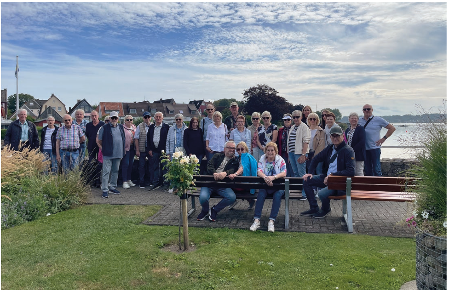
Reisegruppe vor der Schlei in Schleswig

Mit vielen recht unterschiedlichen Eindrücken und Erlebnissen wurde die Heimreise fortgesetzt. Während der Fahrt sorgten gemeinsam gesungene Volkslieder für gute Laune an Bord. Für das kommende Jahr ist eine Fahrt nach Heidelberg, Frankfurt und Mainz geplant, sie findet vom 27. bis 30. August 2026 statt.