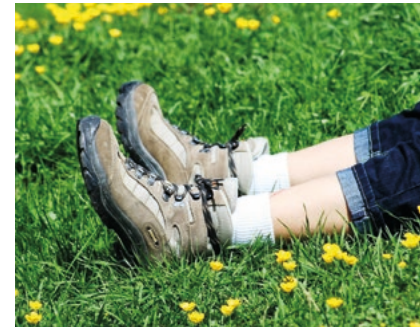
Auf zum 13. Meller Wandertag nach Wellingholzhausen!