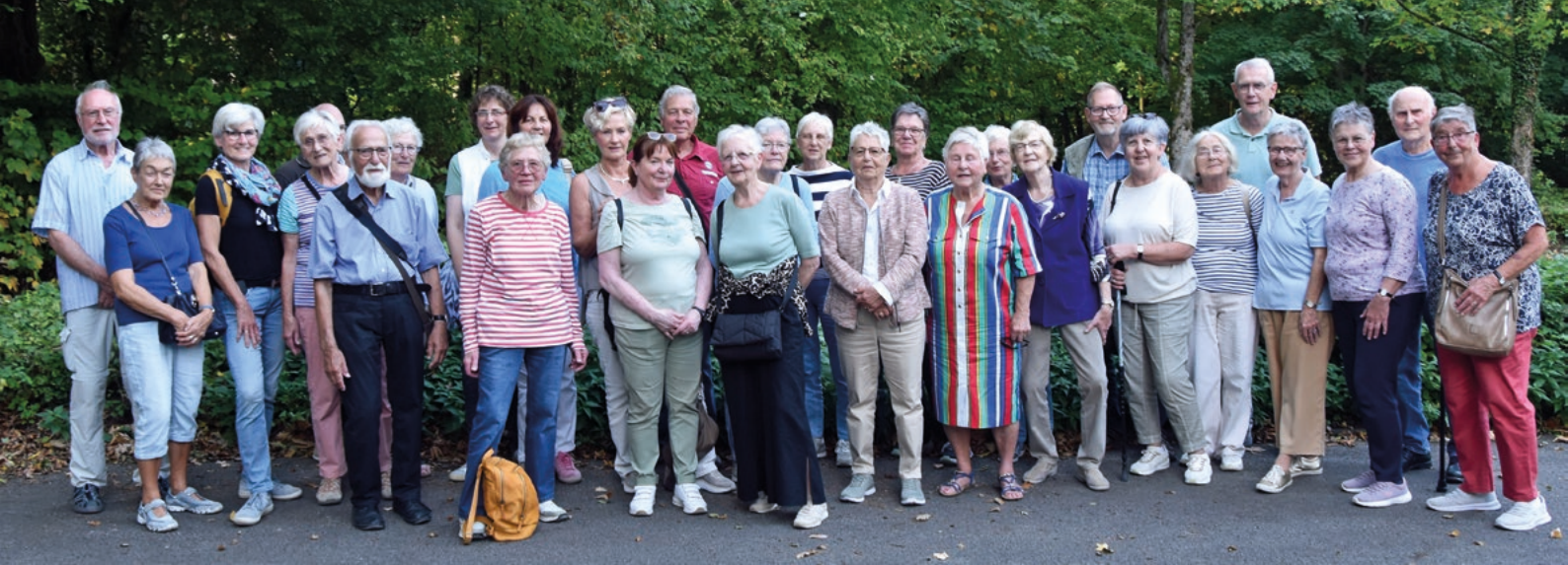
Ein gelungener Ausflugs- tag war die Studienfahrt des Heimat- und Verkehrsvereins Bramsche zur ehemaligen Residenzstadt Detmold und dem Naturdenkmal Externsteine bei Horn-Bad Meinberg.

können, worauf die Teilnehmer, auch wegen des Eintrittspreises, gerne verzichteten. Es ergab sich auch so ein herrliches Bild eines Naturdenkmals, das sowohl in vorchristlicher wie in christlicher Zeit die Menschen anzog und bis heute anzieht. Nach Abfahrt wurde gegen 19.00 Uhr Bramsche erreicht, ein – nach Aussage der Teilnehmer – gelungener Ausflugs- tag ging zu Ende.