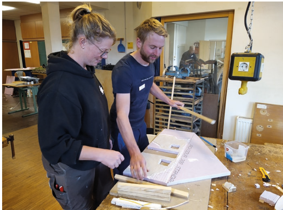
Während des Kurses erhalten die Teilnehmerinnen und Teilnehmer wertvolle Tipps aus erster Hand, um besonders ansprechende Weihnachtskrippen bauen zu können.

Anmeldungen sind ab sofort beim Krippenverein per E-Mail unter krippenverein-osnabrueck@outlook.de , telefonisch in der Geschäftsstelle des Krippenvereins unter 05401 35674 oder beim Vorsitzenden per E-Mail unter krippenbernd@web.de möglich.