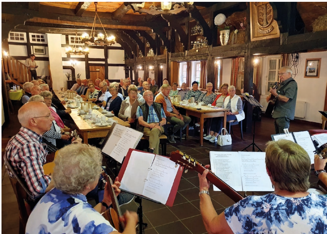
Das diesjährige Offene Singen des Kreisheimatbundes Bersenbrück (KHBB) fand auf Einladung des Heimatvereins Settrup im Heimathaus des Orts statt.

der einzelnen Lieder und besonders die breite Auswahl der Lieder trafen den Geschmack der Sängerinnen und Sänger. Der sehr gute Zuspruch für die Veranstaltung ermuntert den KHBB, auch im nächsten Jahr wieder das Offene Singen anzubieten.