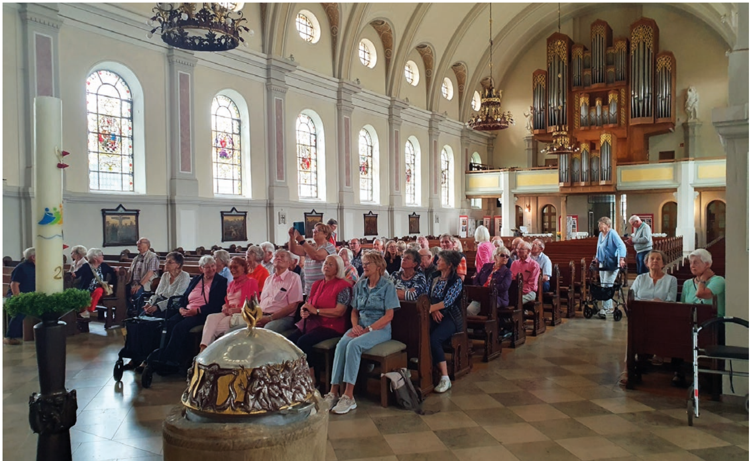
Unter Führung besichtigten die Heimatfreunde aus Bersenbrück auf ihrer Tagesfahrt die St.-Martinus-Kirche, den „Emsland-Dom“, in Haren an der Ems.

Ziele waren Werlte, Haren und Papenburg sowie Ter Apel