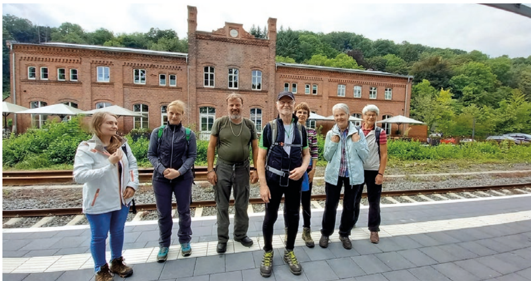
Teilnehmer vor dem historischen Bahnhof Vlotho von 1875.

und so ging es beschwingten Schritts auf schönen Bergpfaden durch den lichtdurchfluteten Hochwald ins Westertal hinunter. Über einen Bahnübergang wurde zwischen Fluss und Gleis der Bahnhof Vlotho erreicht. Nach einer kleinen Einkehr in der „Brotzeit“ im Bahnhof brachte der Zug die Teilnehmer zurück nach Löhne.