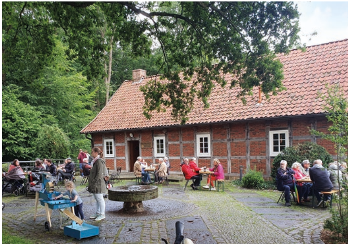
Einen sehr guten Besuch verzeichnete der Heimatverein Bersenbrück am diesjährigen Mühlentag.

öffnen dann ihre Tore für Besucherinnen und Besucher. Seit vielen Jahren beteiligt sich auch der Heimatverein Bersenbrück mit seinem Heimathaus Feldmühle an dieser Aktion, die einen großartigen Zuspruch fand.