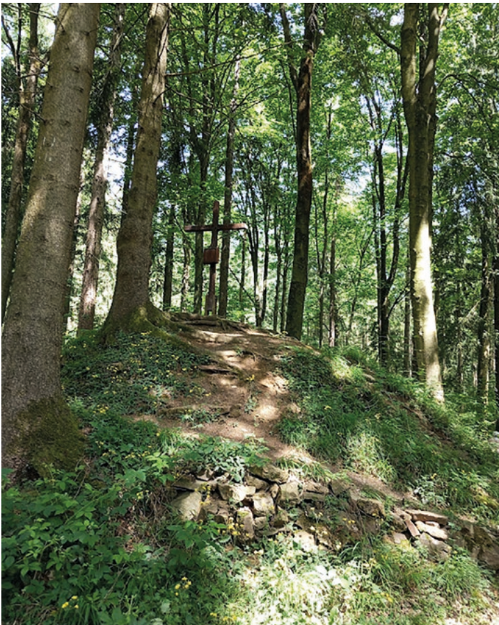
Die Schmittenhöhe in Kalkriese