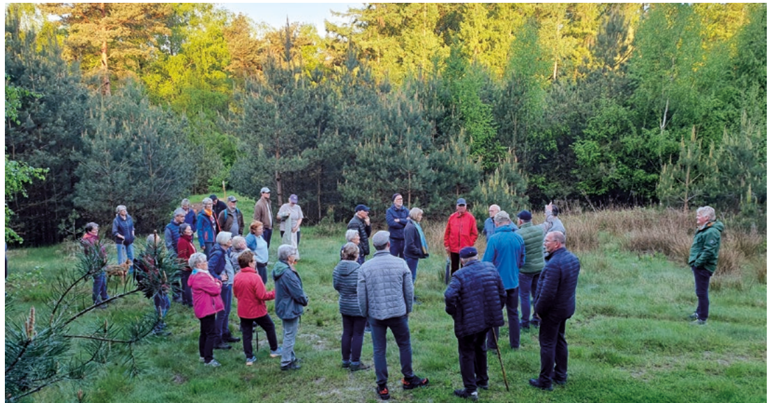
Die Traditionswanderung am 1. Mai führte durch die umliegende Landschaft der Maiburg im Bippen.

auch „Düvels Brotschapp“ genannt. Wie die Bezeichnungen schon deutlich machen, hat in christlicher Zeit eine Verteufelung dieser heidnischen Plätze stattgefunden. Das ganze Waldgebiet der Maiburg besitzt zudem heute noch eine reichhaltige Flora und Fauna. Zum Abschluss der sehr aufschlussreichen Wanderung wurde traditionell das Lied „Der Mai ist gekommen“ angestimmt. Die Veranstaltung endete mit einem ausgiebigen Frühstück im Heimathaus Bippen, bei dem in geselliger Runde die Wandererlebnisse zum Thema wurden.