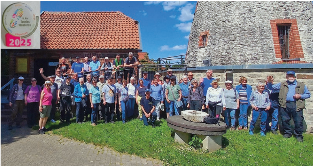
Zum bundesweiten Tag des Wanderns trafen sich circa 50 Wanderer auf Einladung des HV Spenge.