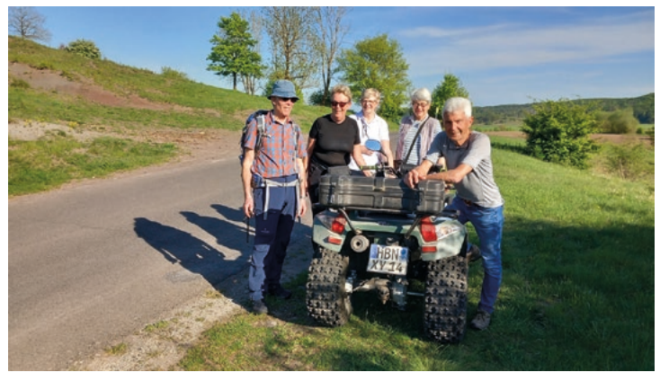
Die Gruppe der TVL-Wanderer bei Schlechtsart.